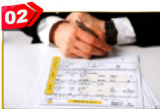
02 فرم های مورد نظر را پر کنید