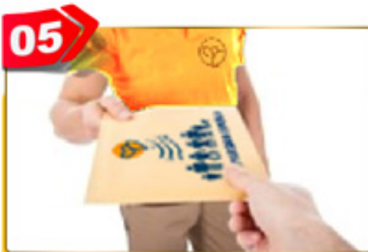
05 به رایگان برایتان ارسال می گردد