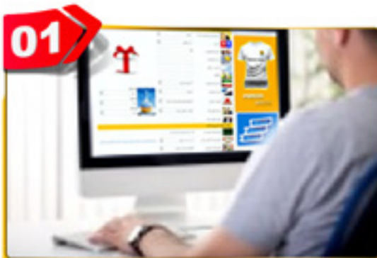
01 بیمه خود را آنلاین سفارش دهید