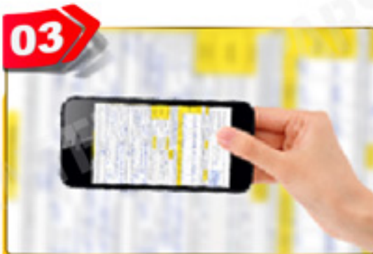
03 با موبایل عکس گرفته و ارسال کنید